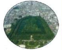
（仁徳天皇陵古墳）

新しい令和の時代を迎え、改めて自国の歴史を振り返り、遺された歴史文化資源の価値、その意味を探ります。