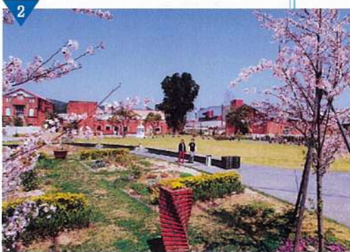
▲レンガ造建物を再利用した市民広場の整備(完了)