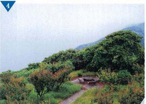
▲紀淡海峡が一望できる「生石公園」の整備(完了)