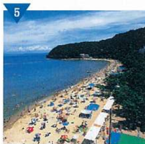
▲大浜公園整備(進行中)