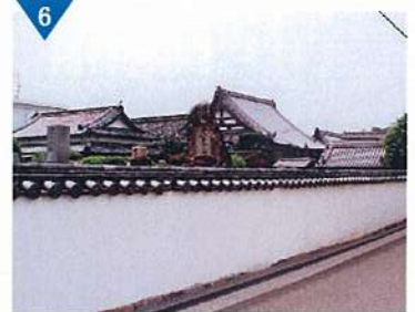
▲城下町の雰囲気は今なお残す「寺町筋」の整備(進行中)