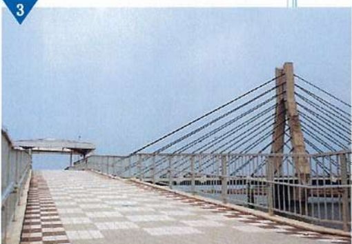
▲自然、文化、歴史が気軽に楽しめる散策路の整備(完了)