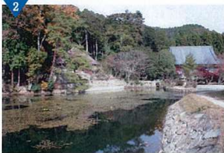
▲中安田(放生池・石積水路)の整備(完了)