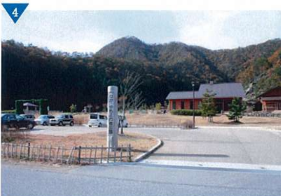
▲県立なかやちよの森公園