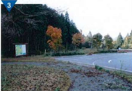
▲ふるさとの玄関づくり事業(完了)