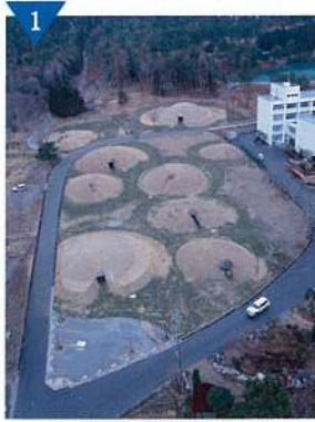
▲東山古墳群整備事業(完了)