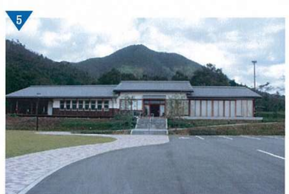
▲那珂ふれあい館本館