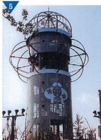
▲「根日女」をモチーフにデザインされた「ランドマーク展望台」の整備(完了)