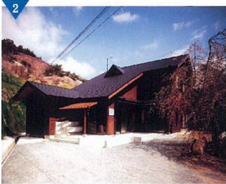
▲石彫が体験できる「石彫アトリエ館」の整備(完了)