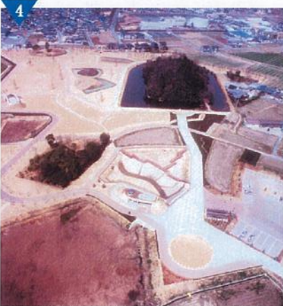
▲6基の古墳と1基の移築復原した古墳がある「玉丘史跡公園」の整備(完了)