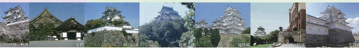
伊賀上野城 二条城 岸和田城 和歌山城 姫路城 大阪城 尼崎城

再建された尼崎城 江戸時代初期、大阪の西の守りとして譜代大名 戸田氏鉄(とだうじかね)により築かれた尼崎城。周辺では、令和2年10月10日に歴史博物館がオープンします。 ●尼崎城址公園管理事務所 TEL.06-6480-5646 【休】月曜日(祝日の場合は営業、翌日休)、年末年始(12月29日~1月2日) 【開】9:00~17:00 /阪神「尼崎駅」下車すぐ。