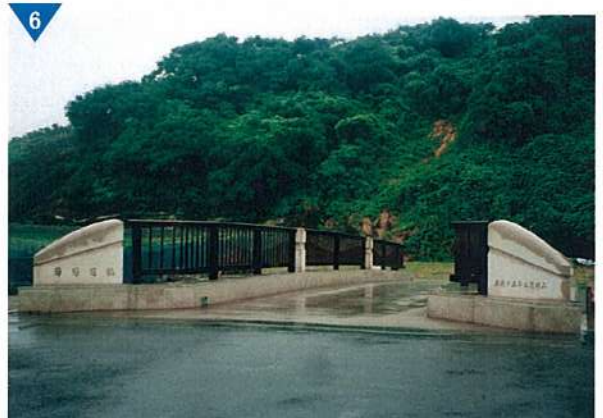
▲特産品のぶどうを橋の名にした「えびかずら橋」の整備(進行中)