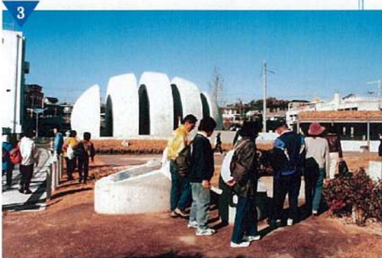
▲石器づくりのアトリエを再現した「翠鳥園遺跡公園」整備(完了)