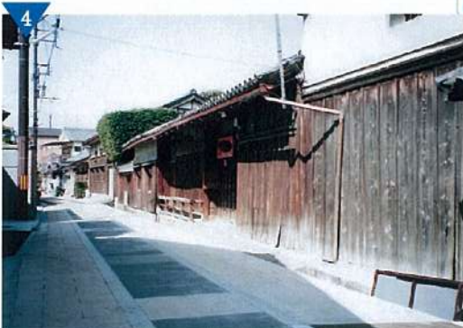
▲日本最古の官道「竹内街道」の整備(完了)