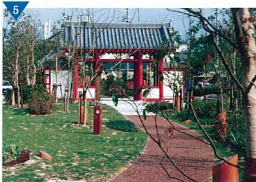
▲飛鳥時代風の山門を再現した「であいのみち」の整備(完了)