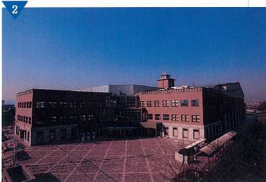
▲生活・文化・情報の拠点「LICはびきの」整備(完了)