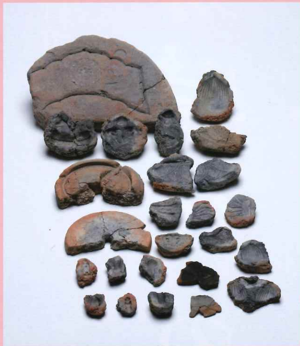
金属製品の鑄型 （平安京左京八条三坊六・十一町跡出土）

平安時代末期の不安定な政情の中で武士が台頭し、朝廷や平氏、源氏の勢力争いが顕在化していきました。鎌倉幕府はこのような情勢の中から相模国・鎌倉で誕生し、武家政権を樹立しました。幕府滅亡までの約150年間存続し、後に「鎌倉時代」と呼ばれる一時代を築きます。