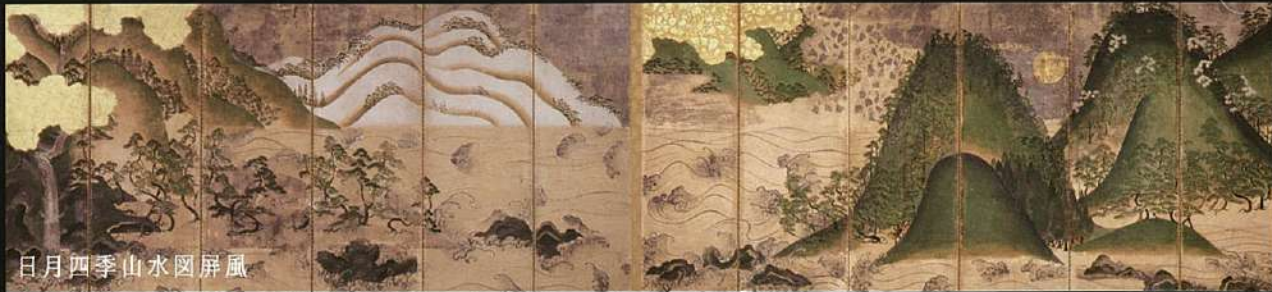
日月四季山水図屏風