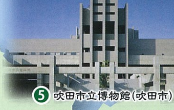
⑤ 吹田市立博物館(吹田市)