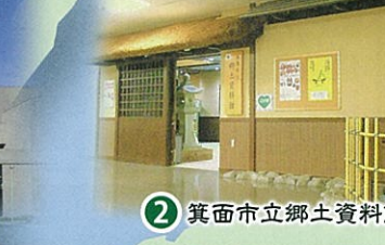
② 箕面市立郷土資料館(箕面市)