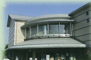
⑩ 高槻市立しろあと歴史館(高槻市)