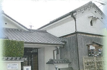
① 宝塚市立小浜宿資料館(宝塚市)