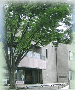
⑥ 向日市文化資料館(向日市)