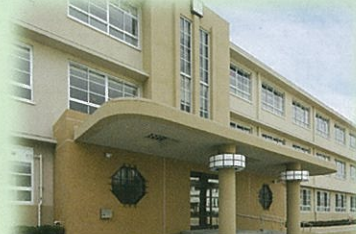
⑨ 尼崎市立歴史博物館(尼崎市)