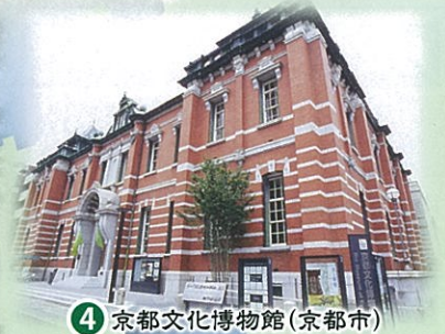
④ 京都文化博物館(京都市)