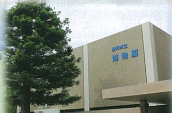
⑧ 伊丹市立博物館(伊丹市)