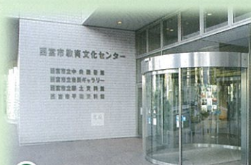
⑬ 西宮市立郷土資料館(西宮市)