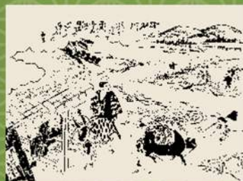
【にしのみやデジタルアーカイブ】