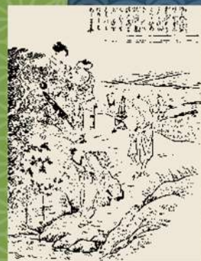
【大阪府立中之島図書館所蔵】