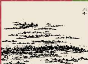
【にしのみやデジタルアーカイブ】