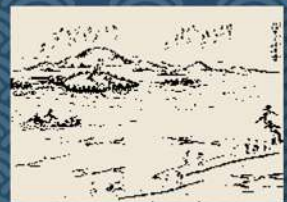
【にしのみやデジタルアーカイブ】