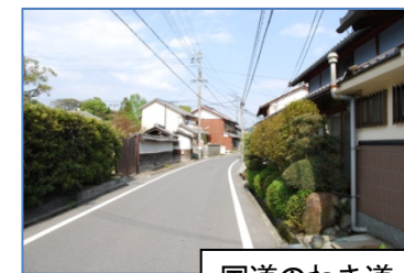
国道のわき道。比較的歩きやすい