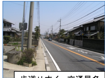
歩道せまく、交通量多いため注意