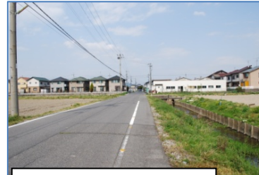
国道のわき道。比較的歩きやすい