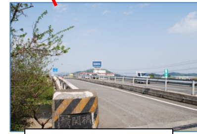
武佐に向かって左側に歩道あり