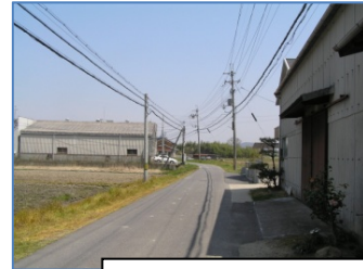
国道のわき道。比較的歩きやすい