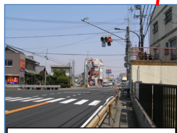
信号を渡り斜め右の旧道へ。歩道せまいため注意