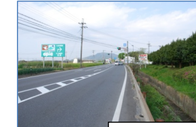
交差点に近づくほど路側帯が狭くなる。交通量（大型）多く、危険