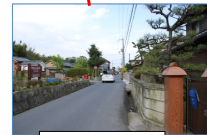
道路狭く、路側帯がないため注意